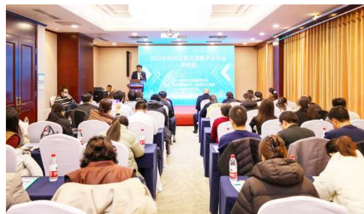
2024年滨州市消化道癌早诊早治培训班。