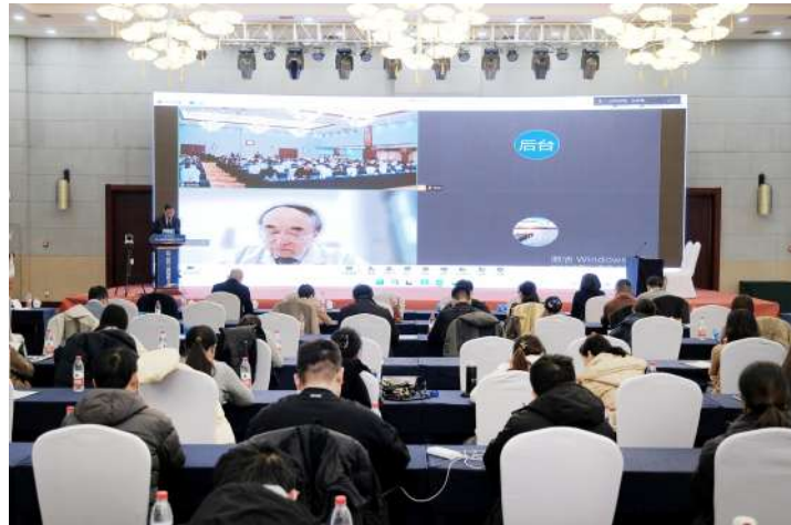
于金明院士通过视频方式参会。

此次大会的召开,为黄河三角洲地区肿瘤防治专家提供了一个广阔的学术交流平台,必将开启市中心医院乃至黄河三角洲地区肿瘤防治工作的新篇章,为人民群众生命安全和身体健康带来更多福祉,为滨州“心安城市”建设添势赋能。