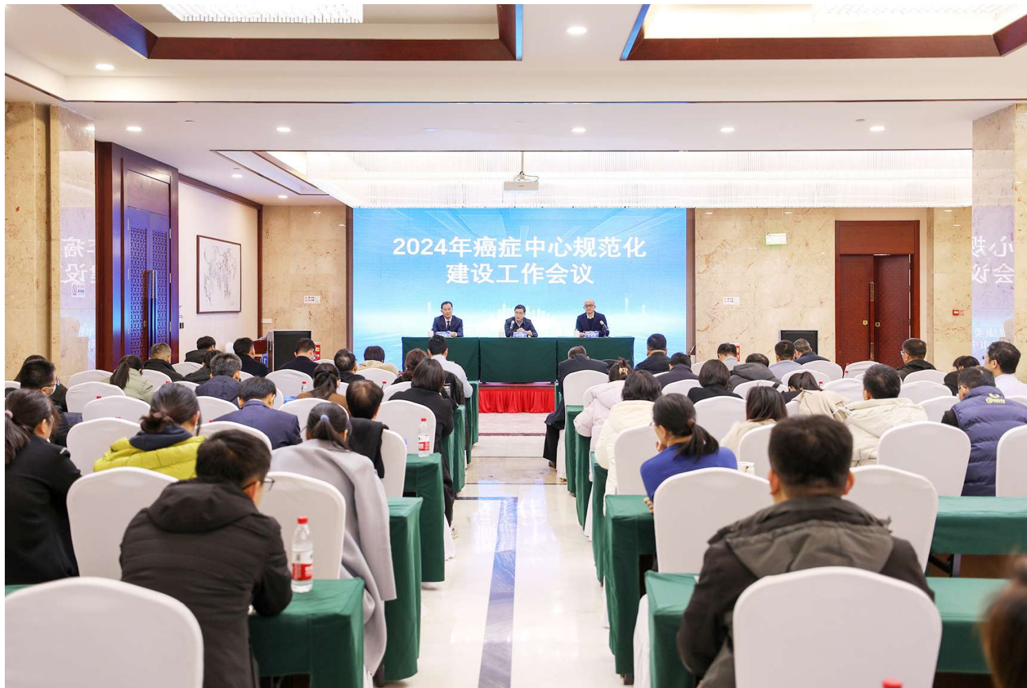
2024年癌症中心规范化建设工作会议。