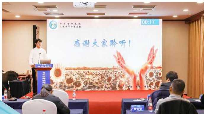
青年医师病例演讲比赛。