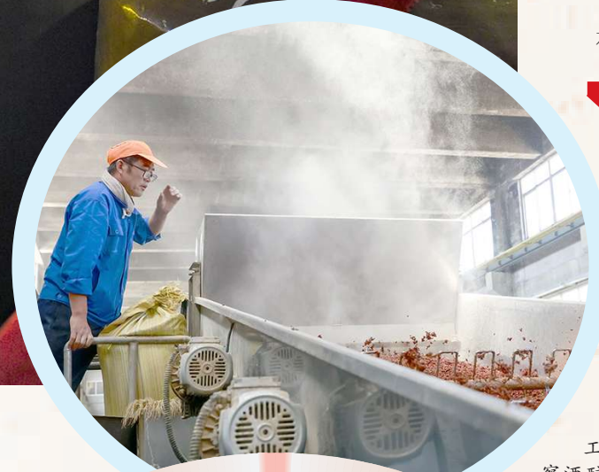
工作人员认真观察酒醅冷散混合的情况,保证酒的品质和口感。