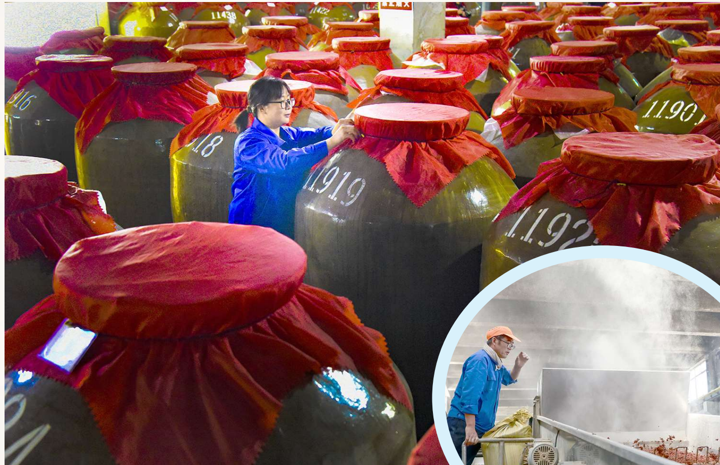
万吨地下酒窖中,技术人员认真检查每一个细节。