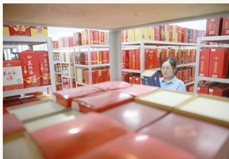
错落有致的陈列架上,摆满天地缘美酒。