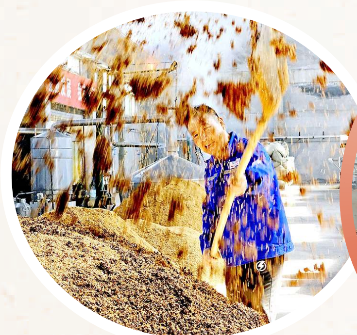
工作人员将高粱酒曲充分搅拌均匀,每一个动作都透露出深厚的经验和对细节的极致把控。