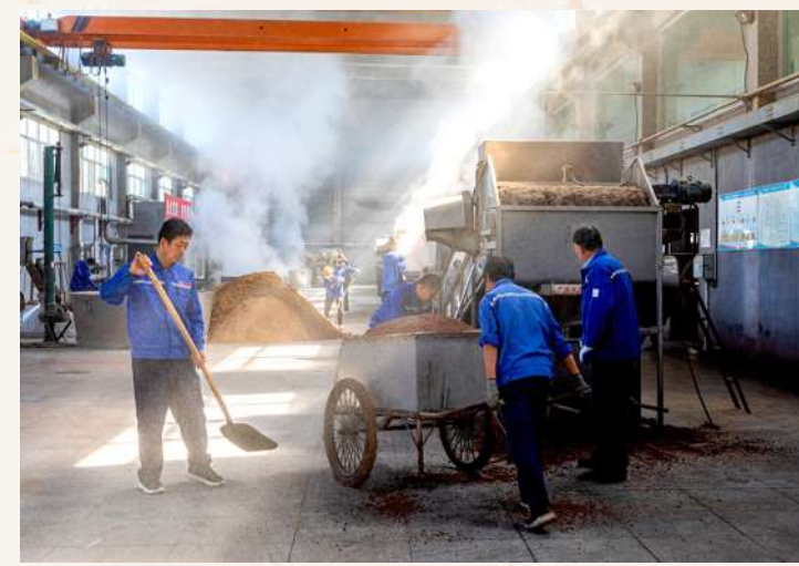
制酒车间内,工作人员正有条不紊的忙碌着。