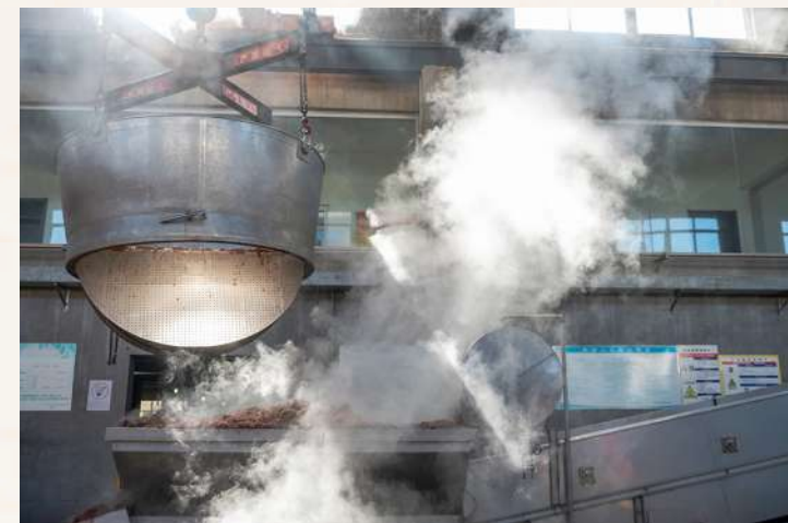
车间内蒸腾的热气与斜射的阳光交织成一幅动人的画面。