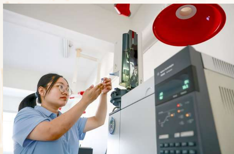
在现代化的实验室中,酒厂技术人员正利用气相色谱仪对酒样进行精密分析。