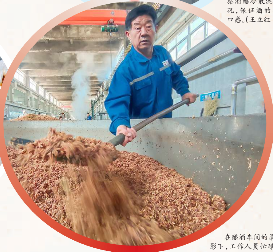
在酿酒车间的柔和光影下,工作人员忙碌地装甑蒸酒。