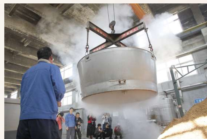
蒸好的原料起锅出甑,摄影师们用镜头捕捉下这一神圣时刻。