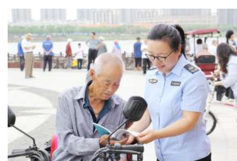
现场开展相关法律法规宣传。