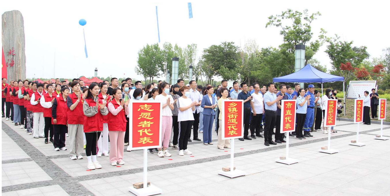
来自全市各界群众代表400余人参加活动。