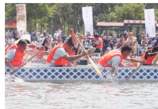
全力拼搏,奋勇争先。