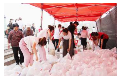
市民热情参与公益放流活动。