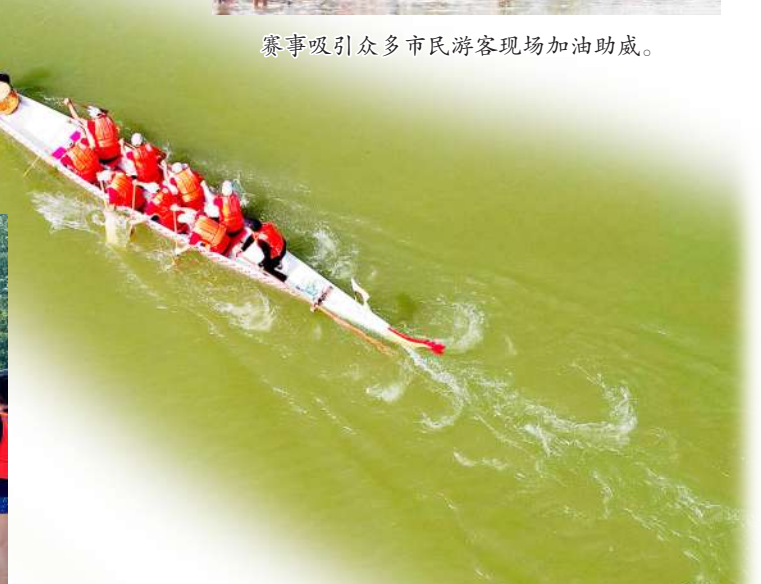
一艘艘龙舟似离弦利箭竞相争渡。