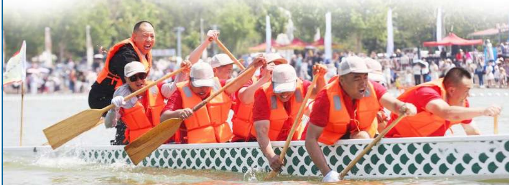
赛龙舟,乘风破浪勇往直前。