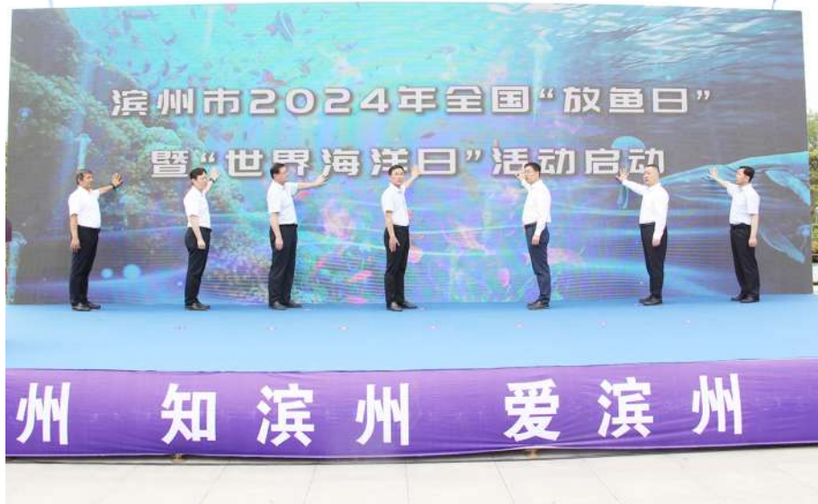
滨州市 2024 年全国“放鱼日”暨“世界海洋日”活动在北海公园启动。

下一步,全市计划放流草鱼、鲢鱼等7个品种8.36亿尾水生生物。同时,我市还开发了“碧水责任·云放鱼”微信小程序,广大群众可以在线免费认领或爱心认购苗种,推动增殖放流活动科学有序开展,为全市海洋生态文明建设再上新台阶贡献积极力量。