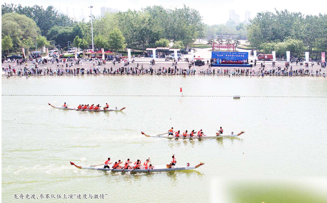
龙舟竞渡,参赛队伍上演“速度与激情”。

据悉,“尖庄杯”滨州市第二届龙舟赛由市委宣传部、市精神文明建设办公室、市总工会、市体育局、市工商联、市体育总会主办。“本届龙舟赛是滨州市纪念毛泽东同志‘发展体育运动,增强人民体质’题词72周年主题系列活动之一,不仅以龙舟赛为媒传承了中华民族优秀传统文化,更有助于滨州创建全国全民运动健身模范市和全国文明城市创建等工作。”