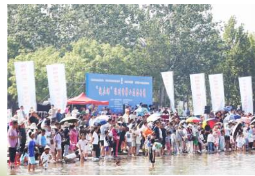
赛事吸引众多市民游客现场加油助威。