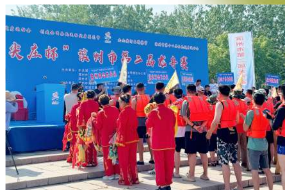
各代表队整装待发。