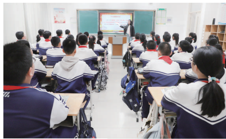
加强未成年人思想道德建设