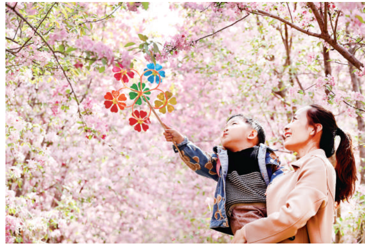
4月13日,市民在滨城区杨柳雪镇的海棠园内赏花游玩。周末,人们纷纷来到户外,感受春日繁花似锦。