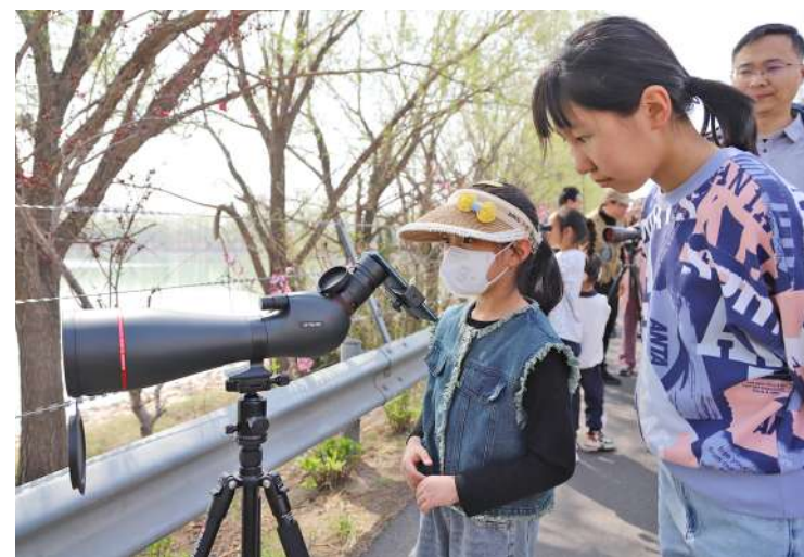
观鸟社团架起多台单筒望远镜,组织学生现场观鸟认鸟。