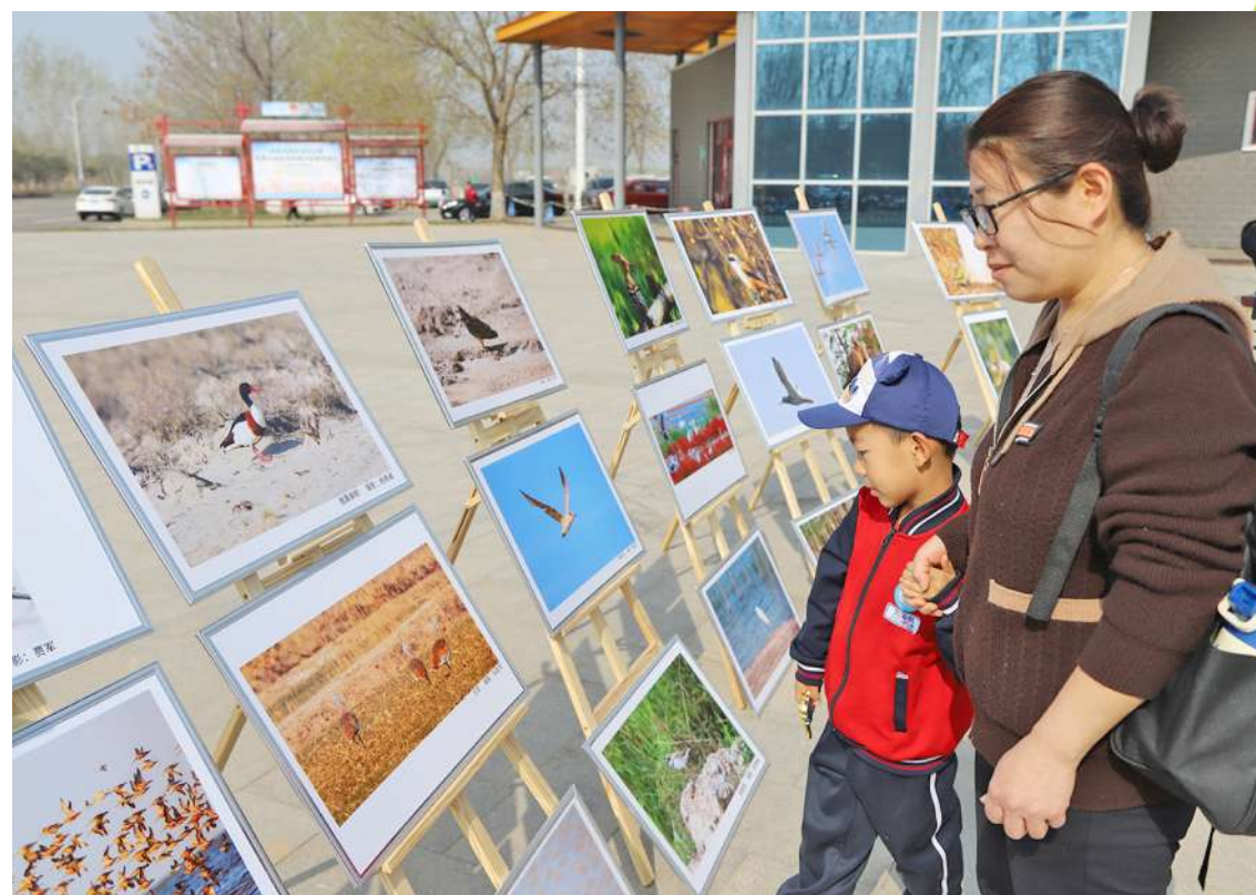
活动现场,一对母子正在欣赏鸟类科普图片。

滨州日报/滨州网讯(记者 郭伟 通讯员 李文娟 胡帅 报道)为传递爱鸟护鸟、保护生物多样性的理念,引导学生发挥小手拉大手作用,主动当好爱鸟护鸟宣传员、劝导员,近日,市自然资源规划局联合团市委、山东航空学院、滨州经济技术开发区管委会在秦皇河国家级湿地公园举行“追风拾野 踏浪寻春”鸟类科普宣传活动。