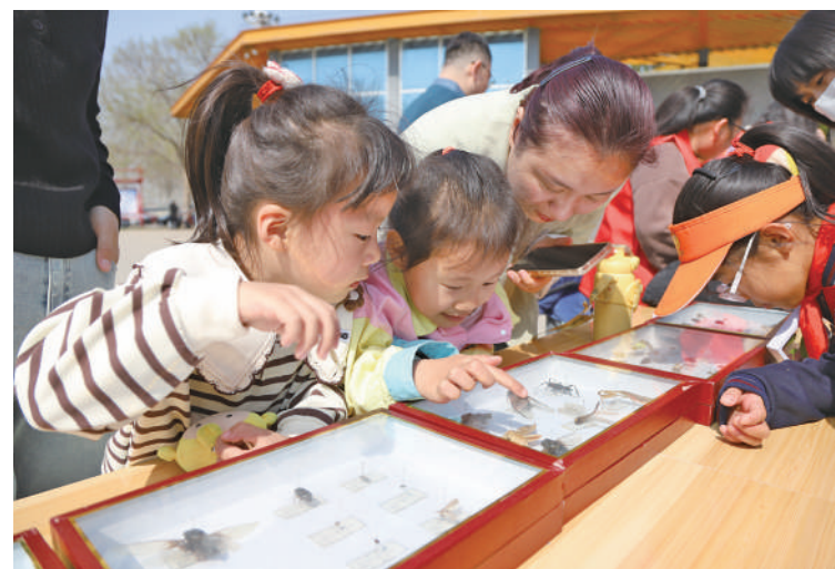
活动共展示昆虫标本70余种。