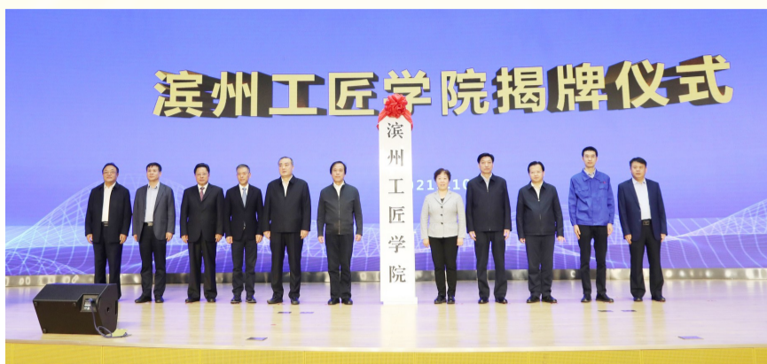
滨州工匠学院成立。

下一步,滨州市技师学院将聚焦制造强市,以深化产教融合为重点,以促进科教融汇为新方向,改进人才培养方式,建设示范性实训中心和产教融合实践基地,推动专业升级和数字化改造,为地方经济发展培养更多高素质技术技能人才和能工巧匠。