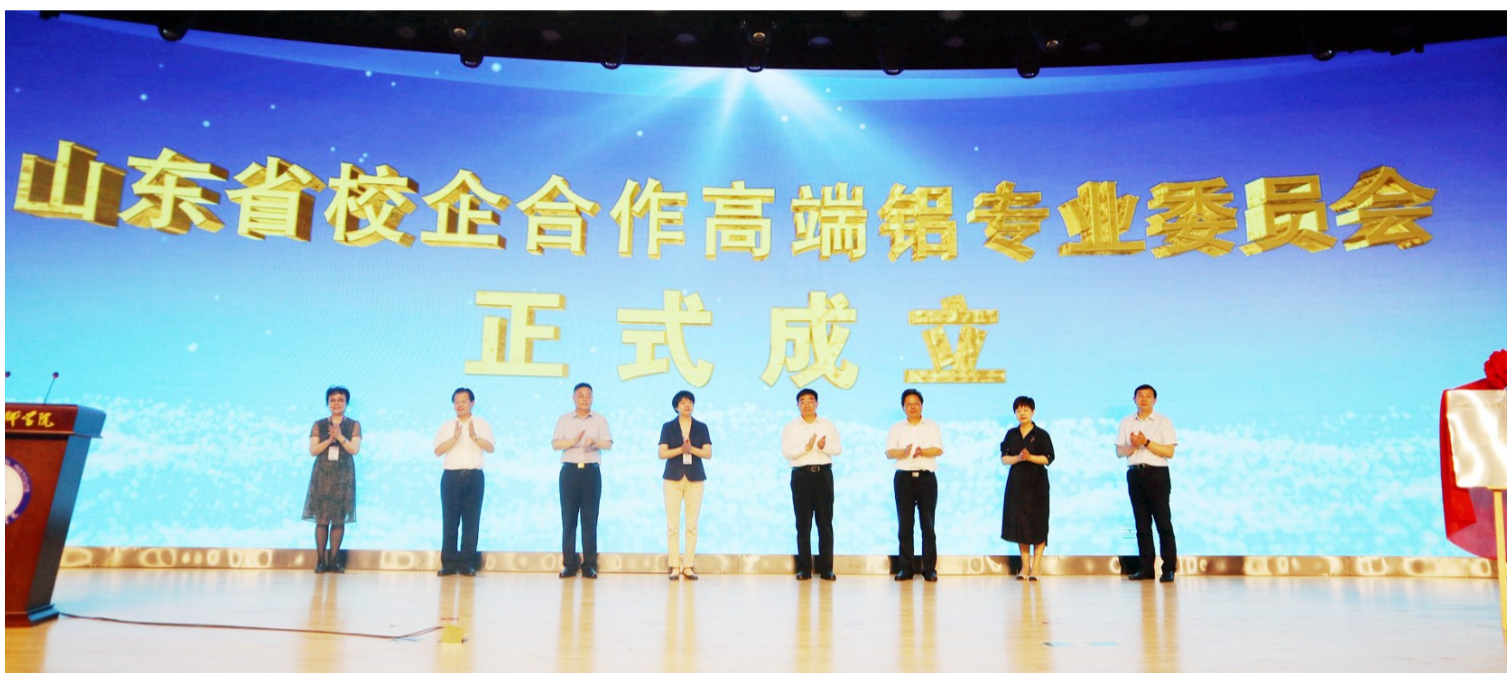
牵头成立山东省高端铝专业委员会。