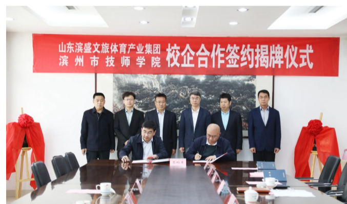
校企合作签约仪式。