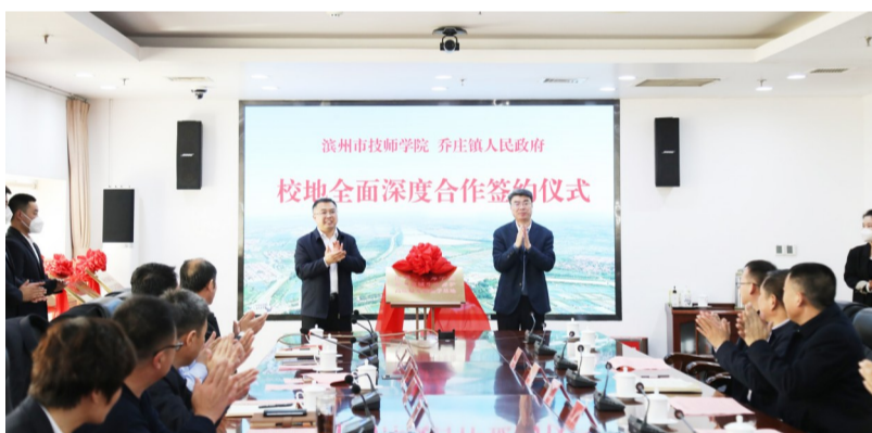
校地合作签约仪式。