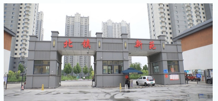
北镇新苑安置小区。