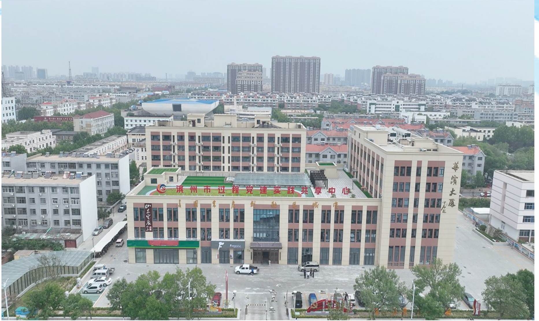
滨州市过程党建实践共享中心。

抓项目就是抓发展,滨城区牢固树立“工业强区、产业富区”理念,助推项目建设跑出“加速度”。上半年新签约项目15个,计划投资238.73亿元,同比增长237%。其中过10亿元项目6个,世界500强项目2个。全区到位市外资金58.69亿元;实际利用外资5630万美元,同比增长317.97%,增幅列全市(7个县区)第1位。71个省市区三级重点项目完成投资91.31亿元,超时序进度28.1个百分点。上半年已