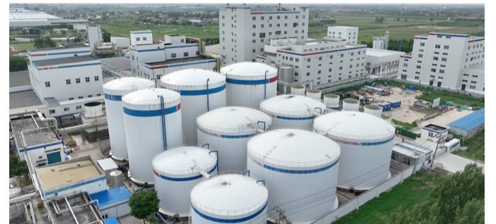
安琪酵母(滨州)有限公司。