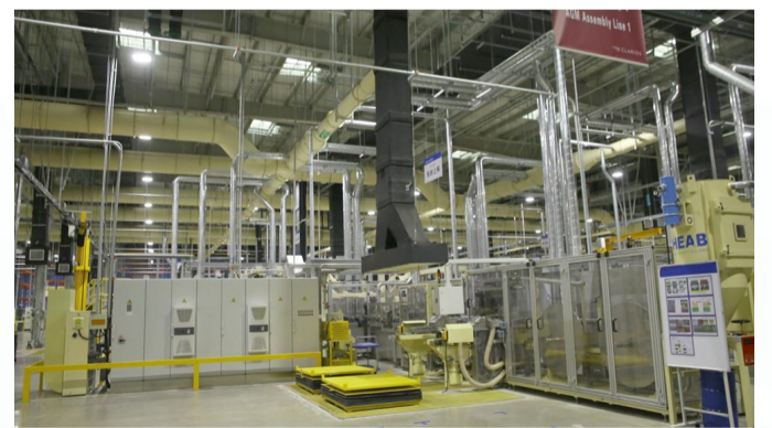
柯锐世启停电池项目。