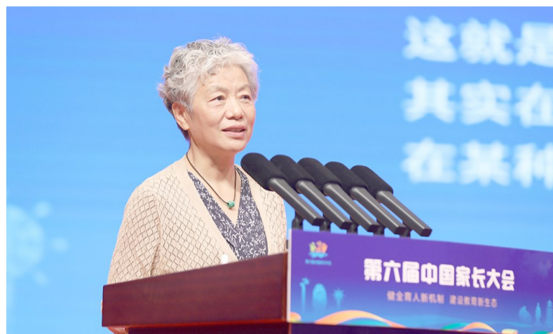
李玫瑾在第六届中国家长大会上作主旨报告。

修养的关键在心,人的真正成熟是心理的成熟。李玫瑾说,可以通过四个指标来评判是否心理成熟:其一是意识水平,自我反思意识越好,则修养越好;其二是认识水平,长远思维越好,则修养越好;其三是情绪水平,自我情绪觉察与管理越好,则修养越好;其四是情感水