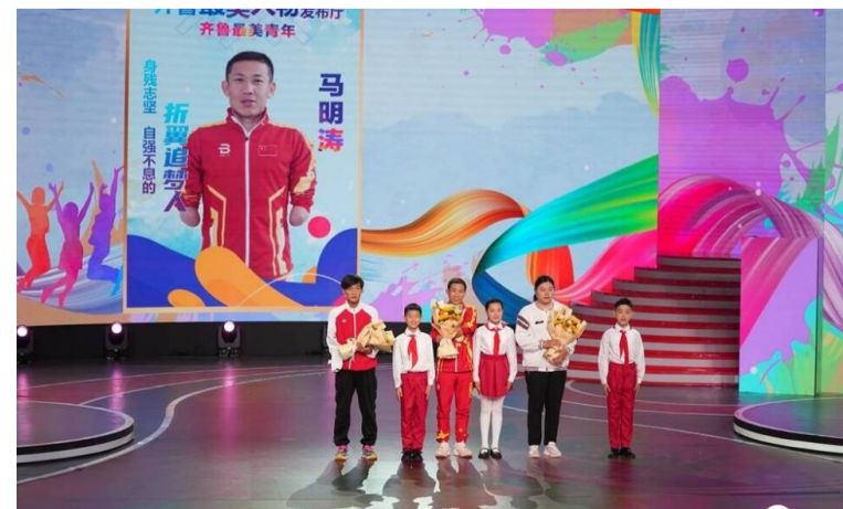
2023年“齐鲁最美青年”发布仪式现场。

运动生涯,并先后参加了两届冬季残奥会。通过不懈努力,他多次参加世界级比赛,为祖国争得荣誉。2022年,他身披中国队战袍,站上