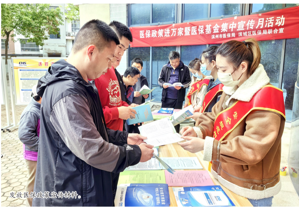
发放医保政策宣传材料。

下一步,全市医保系统将深入开展“医保政策进万家暨医保基金集中宣传月”活动,进一步规范医保服务行为,强化医保基金监管,筑牢基金医保防线,守好老百姓的“救命钱”。