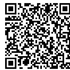
扫码查看祭祀桶位置分布

点位焚烧纸钱,或采取家庭追思会、网上祭祀、鲜花祭祀等文明祭祀方式缅怀亲人,确保清明节期间安全祭扫、文明祭扫。