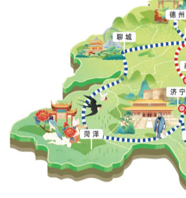
行走百年胶济·高铁环游齐鲁

窑红绿彩、东明粮画等110多个工艺精湛的非遗项目,让体验者驻足观赏、流连忘返,饱尝一份高铁上的文旅大餐。