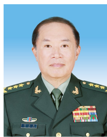
中华人民共和国中央军事委员会副主席 何卫东

张又侠,男,汉族,1950年7月生,陕西渭南人,1968年12月入伍,1969年5月加入中国共产党,军事学院基本系毕业,大专学历。现任中共二十届中央政治局委员,中共中央军事委员会副主席,中华人民共和国中央军事委员会副主席,陆军上将军衔。