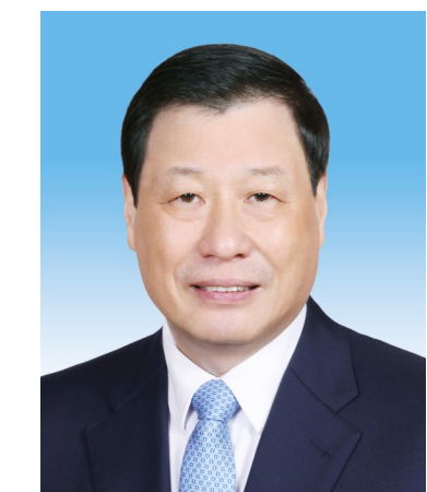
最高人民检察院检察长 应勇

张军,男,汉族,1956年10月生,山东博兴人,1973年1月参加工作,1974年5月加入中国共产党,中国人民大学法律系刑法专业毕业,研究生学历,法学博士学位。现任中共二十届中央委员,最高人民法院院长、党组书记、审判委员会委员,首席大法官。