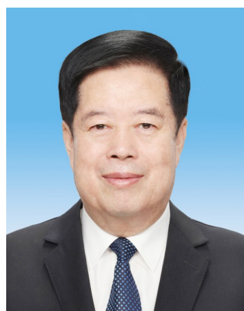
国家监察委员会主任 刘金国

刘金国,男,汉族,1955年4月生,河北昌黎人,1976年12月参加工作,1975年9月加入中国共产党,中央党校大学学历。现任中共二十届中央书记处书记,中央纪律检查委员会副书记,国家监察委员会主任,总监察官。