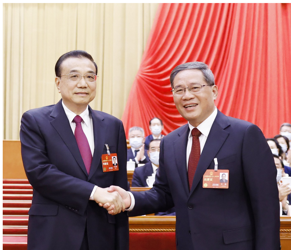
三月十一日,十四届全国人大一次会议在北京人民大会堂举行第四次全体会议,根据国家主席习近平的提名,经过投票表决,决定李强为中华人民共和国国务院总理。这是李强同李克强握手。