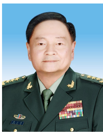
中华人民共和国中央军事委员会副主席 张又侠