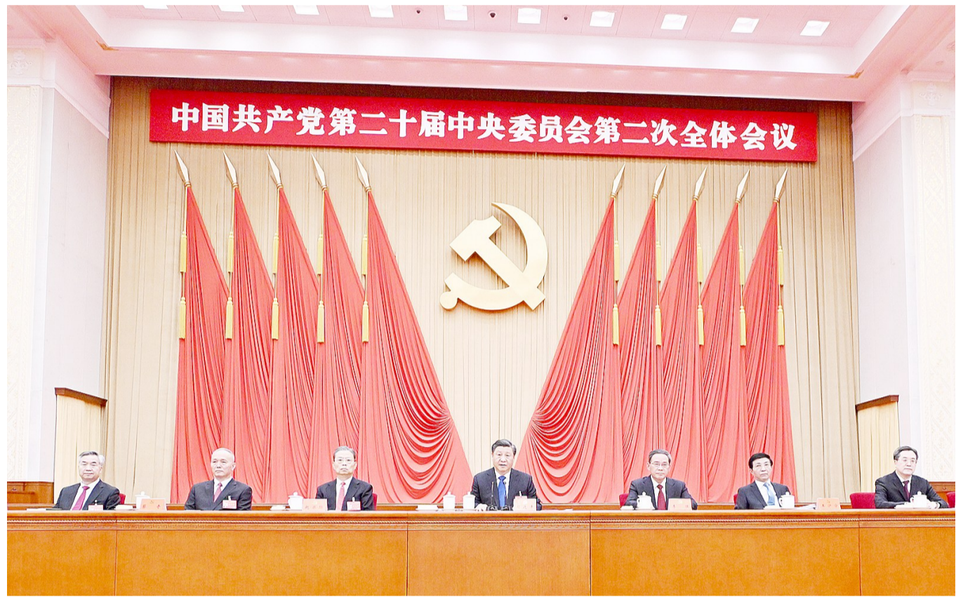
中国共产党第二十届中央委员会第二次全体会议，于2023年2月26日至28日在北京举行。这是习近平、李强、赵乐际、王沪宁、蔡奇、丁薛祥、李希等在主席台上。

新华社北京2月28日电 中国共产党第二十届中央委员会第二次全体会议公报（2023年2月28日中国共产党第二十届中央委员会第二次全体会议通过）中国共产党第二十届中央委员会第二次全体会议，于2023年2月26日至28日在北京举行。