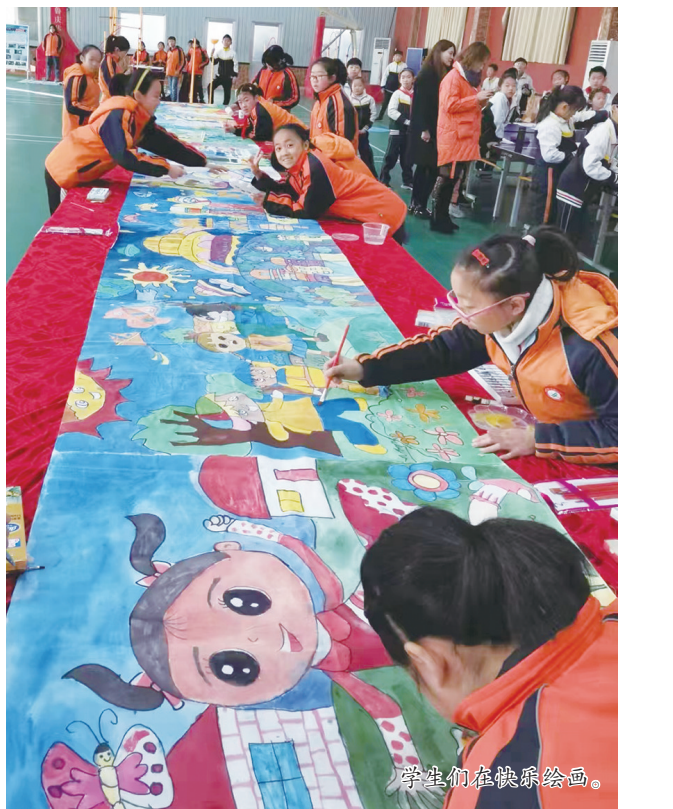
学生们在快乐绘画。

园,种植各类果树,寓意实验小学桃李满天下,实小学子将来心怀国之大者,堪当民族复兴大任;耕读园,种植各类稻果果蔬,耕读传家久,诗书继世长,寓意实小学子能够一以贯之的兼收并蓄、勤学善思、行知两健;百草园,种植各类中草药,传承中医文化,保护世界遗产。各地教育同仁、社会各界朋友、广大师生到“三园”内播种、施肥、灌溉、除草、收割、品尝、游玩,在学习中体验,在体验中学习。