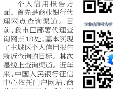
滨州市个人信用报告管理查询网站一揽表