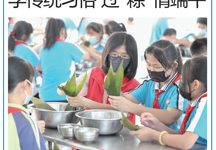
端午节,粽飘香。5月30日,邹平市临池镇妇联、文化站、新时代文明实践所以及中心小学联合举办“学传统习俗,过‘粽’情端午”“六一”国际儿童节暨端午节特别活动。志愿者们边教孩子们包粽子,边向孩子们讲解中华传统习俗,让孩子们在亲手制作美食的过程中领略中华民族传统文化的魅力。

“下一步,我们将通过持续开展各类丰富多彩的文化活动,不断充实本土作家、诗人著作的收录,进一步丰富地方文献馆藏资源,加快推动‘书香滨州’建设。”市图书馆副馆长刘丽华说。