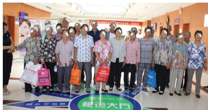
2017年,“慈善光明行”公益救助活动,术后患者重获光明、喜笑颜开。

从建院之初,我就遵循“发展为了患者,发展依靠患者”的宗旨,努力做到让患者满意最大化,其中就包括贫困眼病患者。工作中,我带领医护人员追求精湛的医术、高尚的医德医风、优质的管理服务,以此造福百姓。得益于此,医院的综合实力不断提升,优质的医疗服务赢得了患者