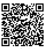
人工智能与创意编程