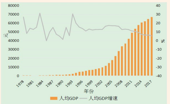
1978年-2017年滨州市人均GDP及增速

下一步，按照以“四新”促“四化”实现“四上”的总体思路，我市将持续推进新旧动能转换重大工程，聚焦“十强产业”发展目标任务，突出高质量发展要求，突出创新驱动和开放拓展，更加注重转变发展方式、明确发展定位，因地制宜确立经济转型突破方向和产业优化提升重点；紧盯科技革命和产业变革前沿，坚持目标引领、问题导向，促进质量变革、效率变革、动力变革。加快运用互联网、大数据、人工智能等信息技术改造提升高端铝、高端化工、高效生态纺织、粮食加工、畜牧水产五大千亿级产业集群，全力打造传统产业动能转换先行区；推动高端装备制造、医养健康、现代旅游业、现代金融、新能源新材料等五大新兴产业扩容增效、加速崛起，打造智慧产业融合发展试验区。