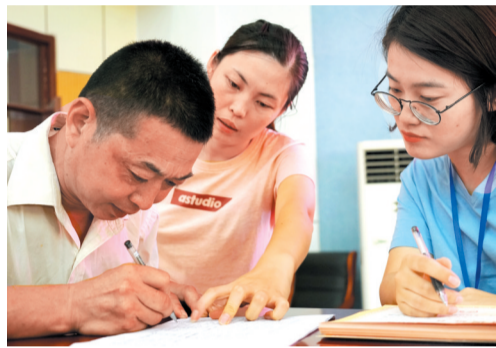
60余名学员现场报名参加定向就业。