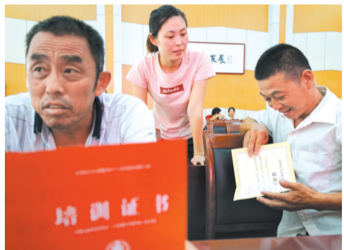
此次培训优先安排建档立卡贫困户参加,一位贫困户表示将会学以致用。