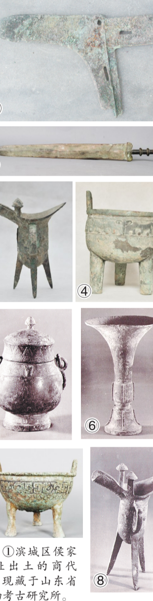
①滨城区侯家遗址出土的商代戈,现藏于山东省文物考古研究所。 ②邹平明集镇大张村出土的春秋时期青铜剑,邹平县文管所提供。 ③惠民县大郭遗址出土的青铜卣,惠民县博物馆提供。 ④大郭遗址出土的虎纹铜鼎,惠民县博物馆提供。 ⑤滨城区兰家遗址出土商代青铜卣。 ⑥滨城区兰家遗址出土的商代铜卣。 ⑦邹平出土的东周双耳三足鼎,邹平县文管所提供。 ⑧滨城区兰家遗址出土的商代铜卣。

遗址的虎纹铜鼎,通高37厘米,口径28.5厘米。腹外部一周饰三对浮雕虎纹图案。所饰虎纹头部微低,四肢半蹲,尾巴卷起,蓄势待发,动感十足。出土于该遗址的商代铜卣,通高18厘米,窄流,尖尾,兽状双柱,条形鬃。深腹圆形底,三棱足,足尖外撇,器形挺拔流畅。腹部装饰的饕餮纹及流涡纹繁缛细密,十分精美。